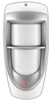
Figure / Figura 1